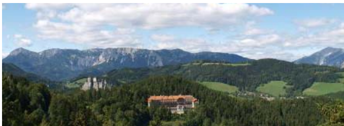
Aussicht im Winter/Sommer